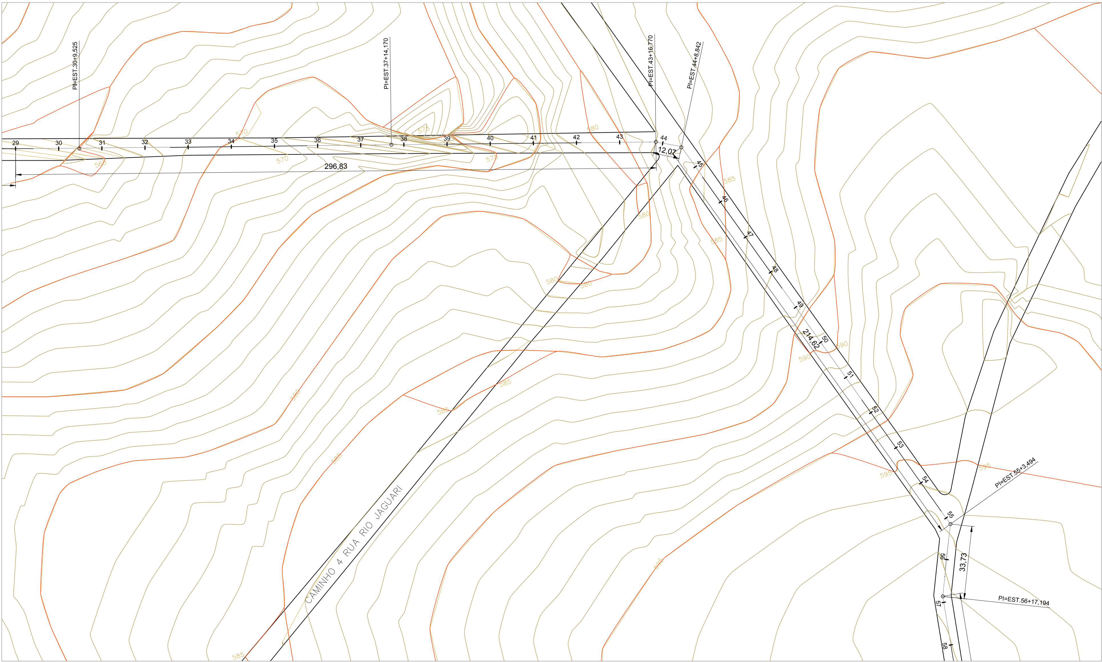
PERFIL TOPOGRÁFICO ESCALA HOR: 1:1000 ESCALA VERT: 1:100